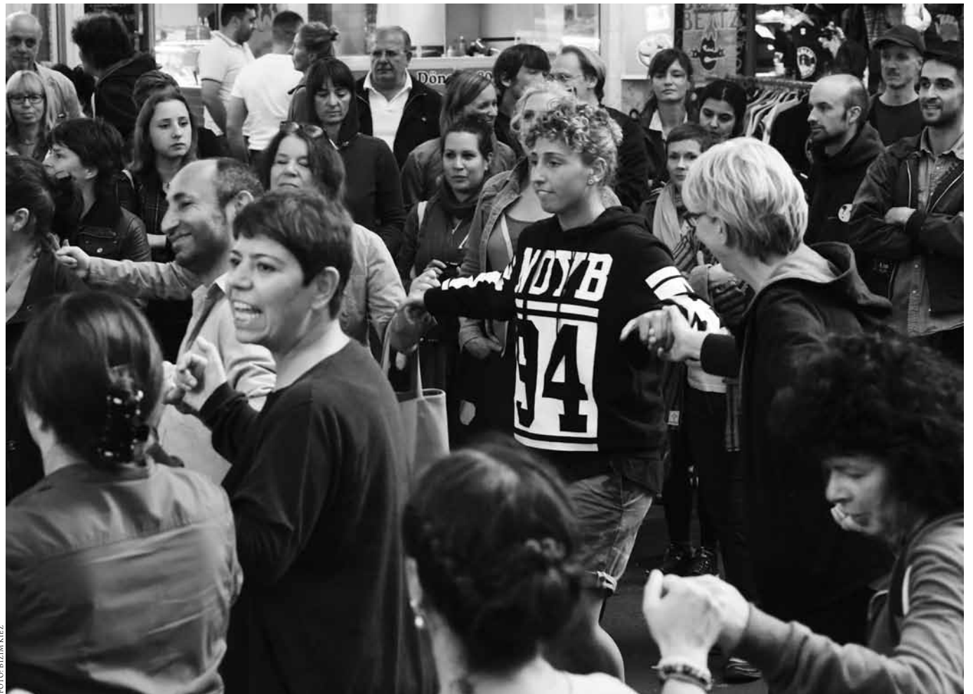
Protest, der verbindet: Halay-tanzende Kiezbewohner_innen in Kreuzberg.

Die Kündigung von »Bizim Bakkal« traf ins Herz.